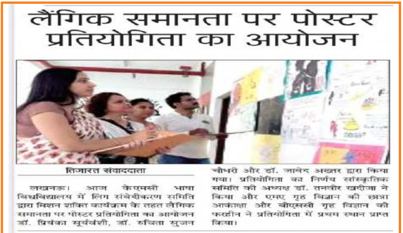
News Coverage about Counselling Cell of University