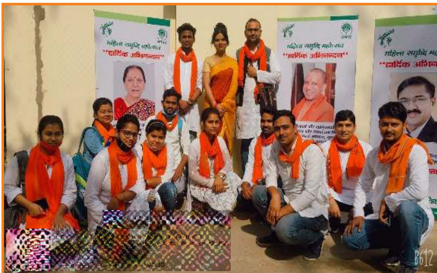
Participation of University Nukkad-Natak team on Social Issues in Mahila Samridhi Mahotsav organized by NABARD at Rajbhavan, U.P., from 8-10 March 2021