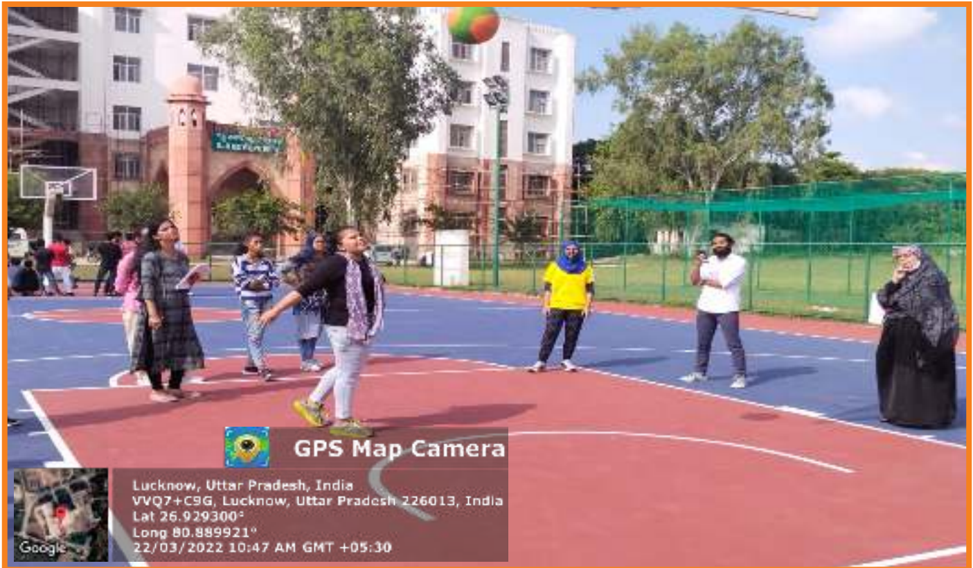
Basketball shooting organized in Basketball Court in campus premises