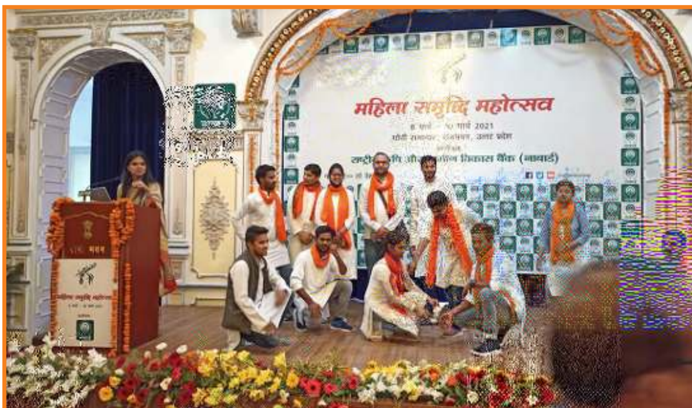
Students performing Skit on the theme "Gender Equality and Dowry System" in Mahila Samriddhi Mahotsav