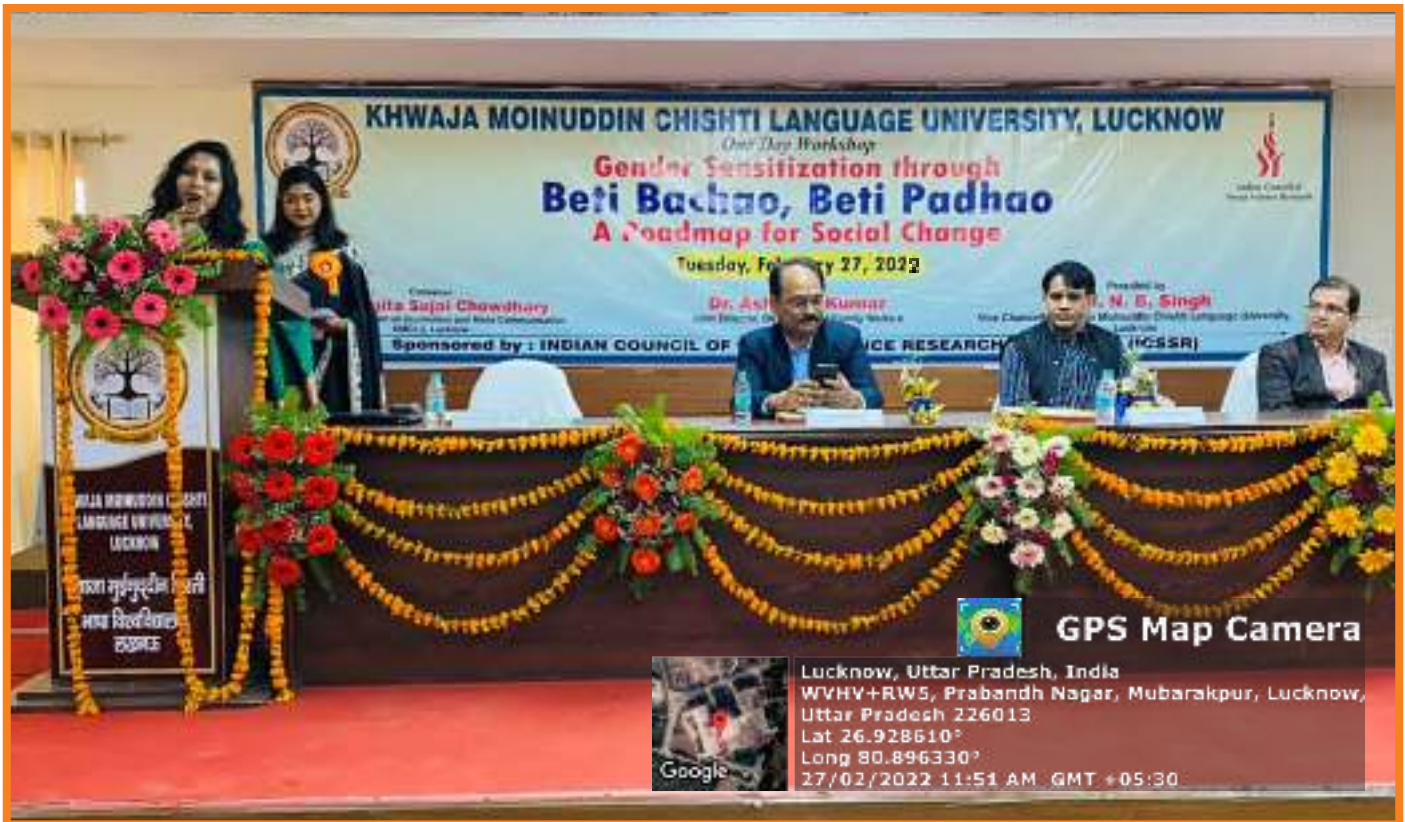
Gender sensitization programme in the University on the theme "Beti Bachao Beti Padhao"