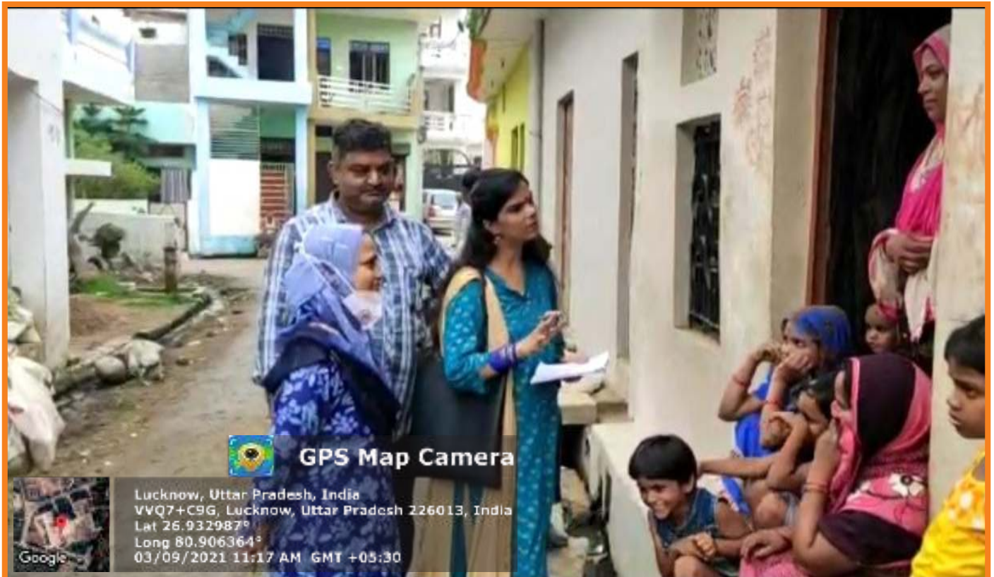
Survey on Gender Equality Organized on Weekly Basis Under Theme “Chuppi Todo Khulkar Bolo” in Adopted Village Lokharia