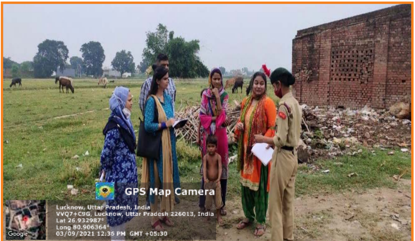
Involvement of NCC Girls in survey on Social Issues related to Nutrition & Health Information Provided in Adopted Village Lokharia