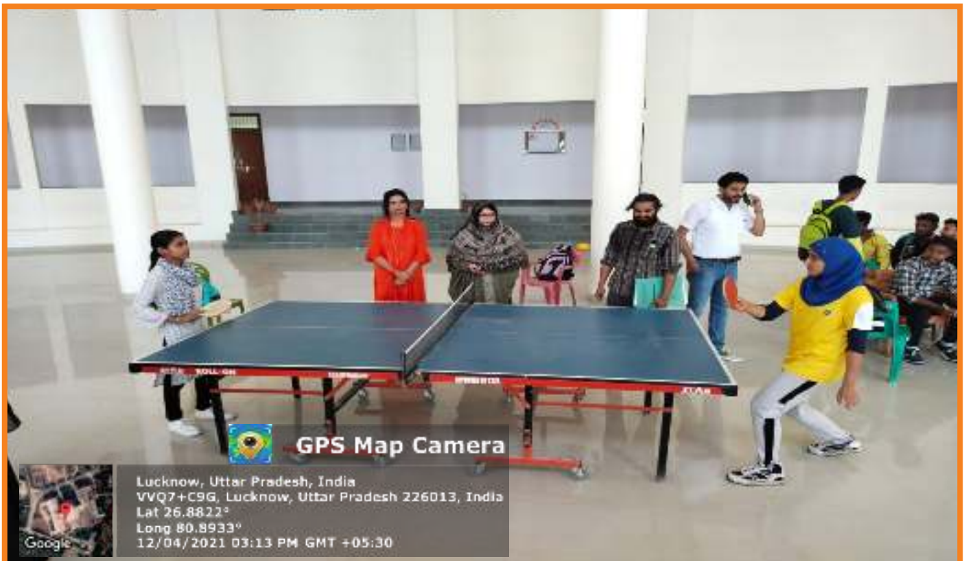
Sports Activity organized in Campus Under Girls Health Club