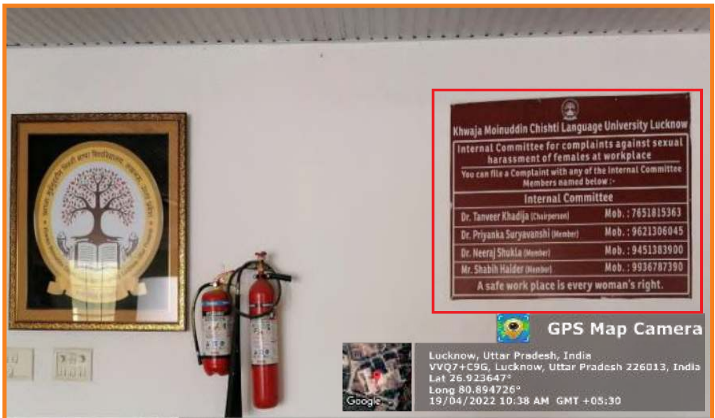
Display Board of Internal Complaint Committee in front of Atal Hall in Academic Block