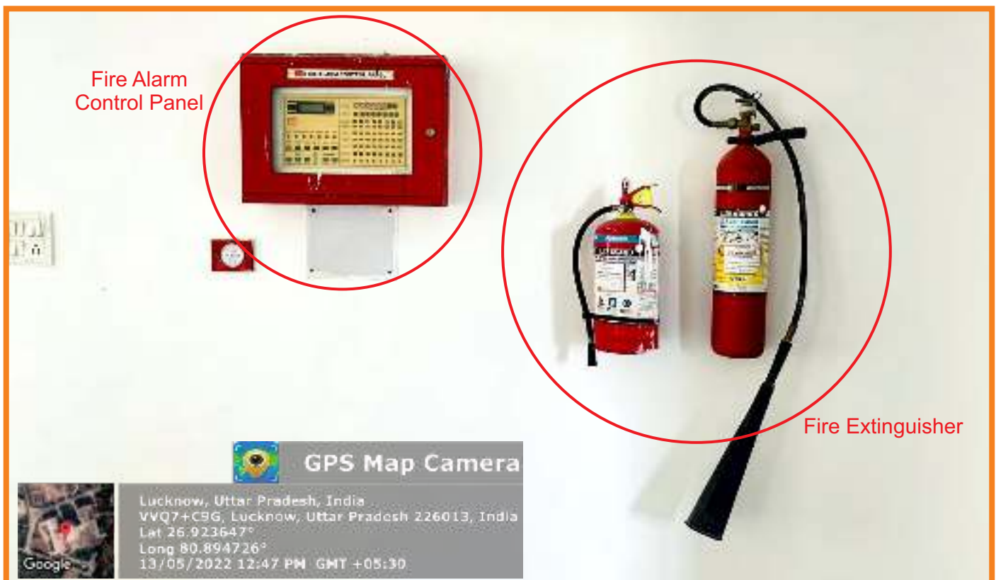
Fire Extinguisher System at various places in University