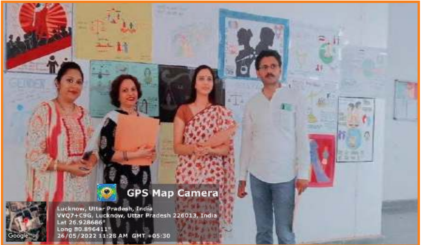
Poster Competition on Gender Equality Organized Under Mission Shakti Programme