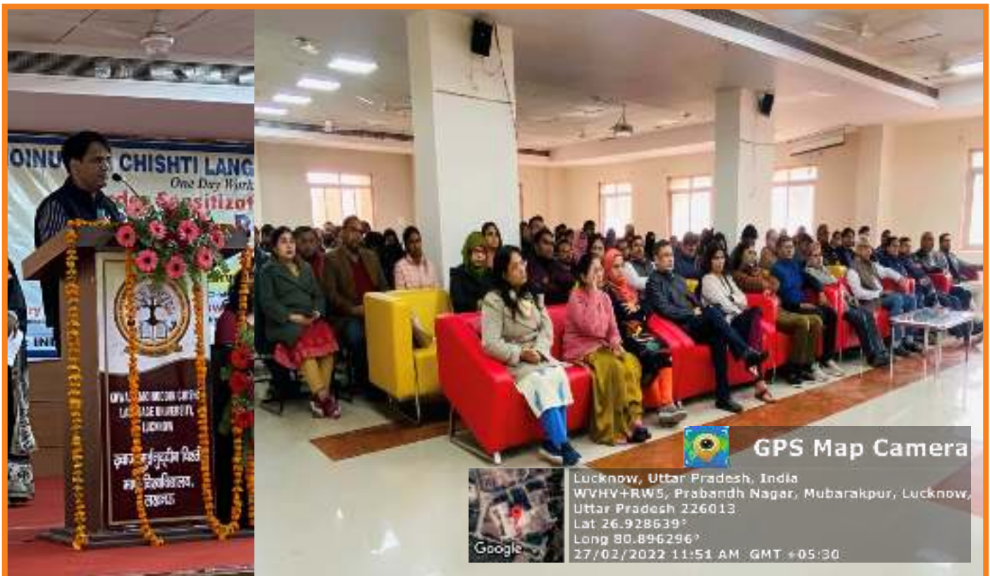
Expert lecture being delivered for gender sensitization of faculty, staff and students