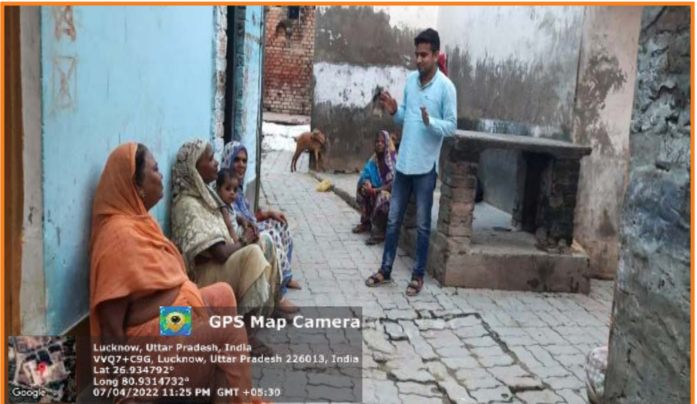
Counseling session organized by Women Study Centre on World Health Awareness Day on 7th April 2022